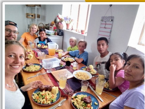
Viele Gäste bei uns zuhause