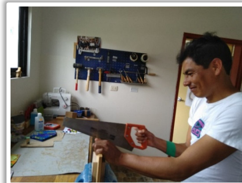
Das erste Mal arbeitet der Patient wieder mit Holz