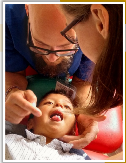
Teamwork mit der Logopädie