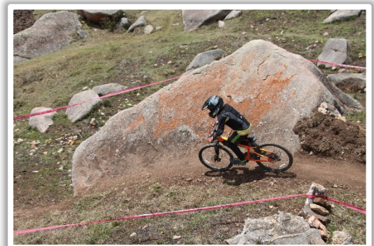
Das erste Downhill-Rennen